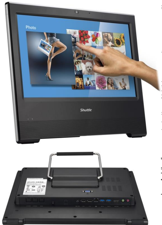
Die Bilder dienen nur zur Illustration.