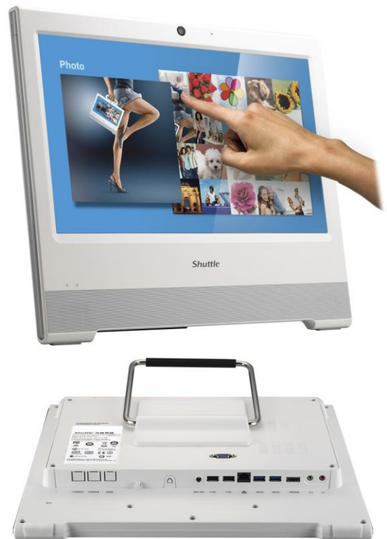
Die Bilder dienen nur zur Illustration.