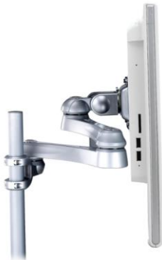
Bild rechts:: Das Gerät lässt sich dann immer noch mit Hilfe einer aufgeklappten Büroklammer einschalten, die man durch ein unscheinbares Loch an der Geräteseite drückt.

Bild links:: Der Einschalt-Button lässt sich deaktivieren, um unbefugtes Betätigen zu unterbinden. Hierzu öffnen Sie den PC und ziehen den entsprechenden Anschluss heraus (siehe Markierung).