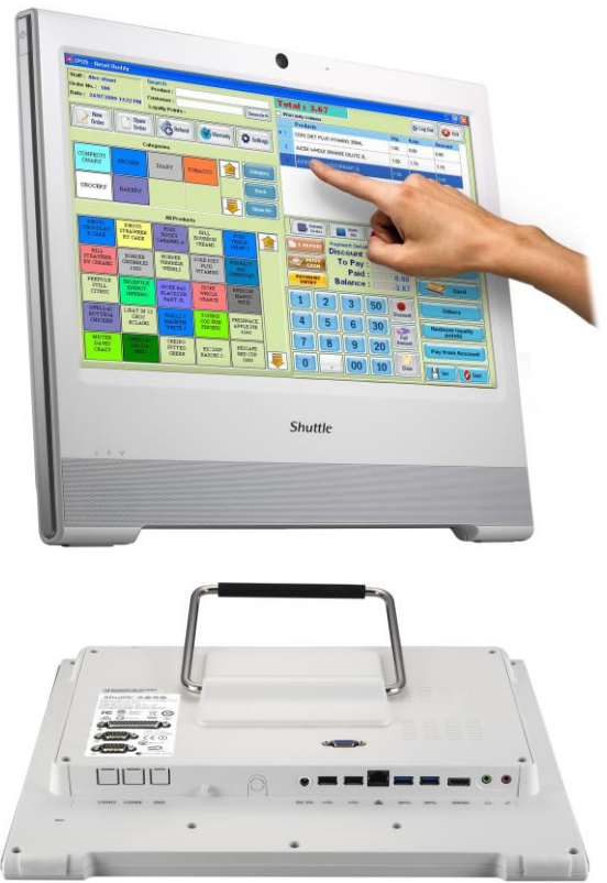
Die Bilder dienen nur zur Illustration.