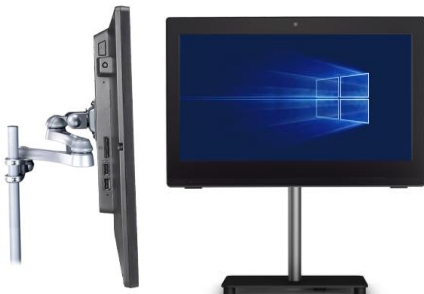
Bild rechts: Das Gerät lässt sich dann immer noch mit Hilfe einer aufgeklappten Büroklammer einschalten, die man durch ein unscheinbares Loch an der Geräteseite drückt.

Bild links: Der Einschalt-Button lässt sich deaktivieren, um unbefugtes Betätigen zu unterbinden. Hierzu öffnen Sie den PC und ziehen den entsprechenden Anschluss heraus (siehe Markierung).