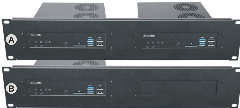
A) zwei montierte PCs B) nur ein PC - plus Abdeckplatte.