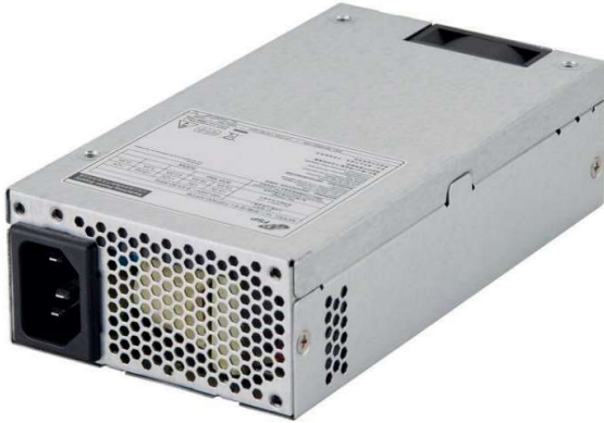
Produktbilder sind nur für illustrative Zwecke

Das Shuttle XPC Accessory FSP500 ist ein Hochleistungsnetzteil mit einer Ausgangsleistung von 500W für bestimmte Shuttle XPCs. Das Netzteil wandelt die Netzspannung in die vom Computer benötigten Niederspannungen. Dank seines hohen Wirkungsgrades erfüllt dieses moderne Netzteil die Anforderungen nach der 80 PLUS Gold Norm und eignet sich für ENERGY STAR® kompatible Systeme.